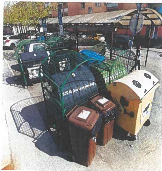
Zlúčené kontajnerovisko pre Šoltésovú 7-9 a 14-8, bude na jestvujúcom mieste nedôjde k záberu verejnej zelene ani parkovacieho miesta.