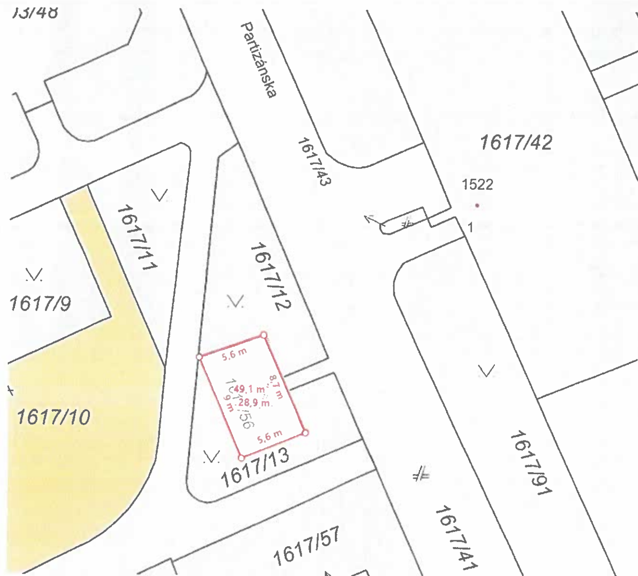
Partizánska 1-3, k.ú. Skladná 1617/56 LV č. 10527