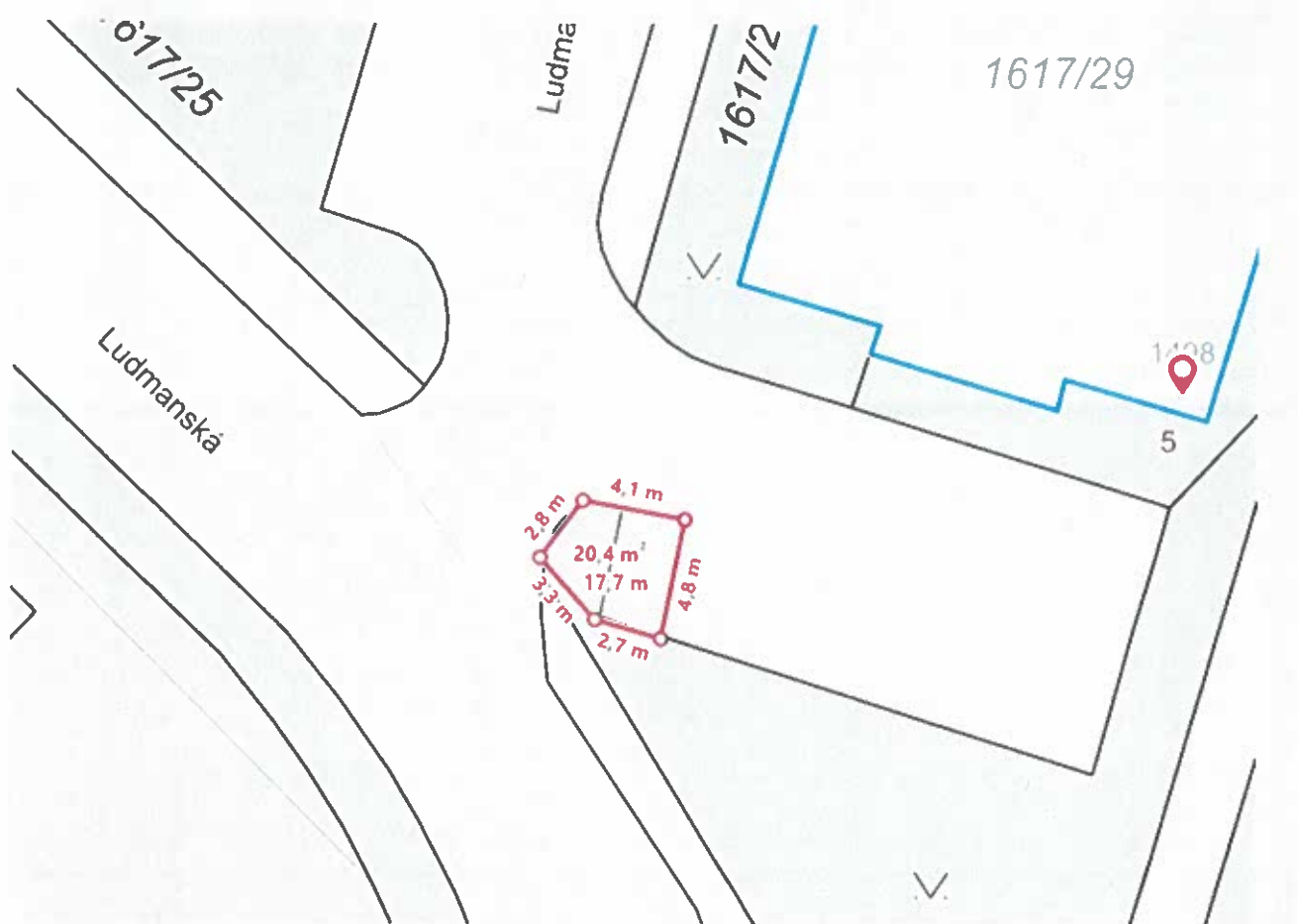
Ludmanská 5, k.ú. Skladná 1617/98, 2496/4 LV č. 10527