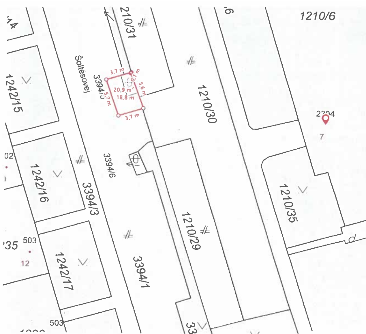
Šoltésovej 7-14, k.ú. Južné mesto LV č. 10650